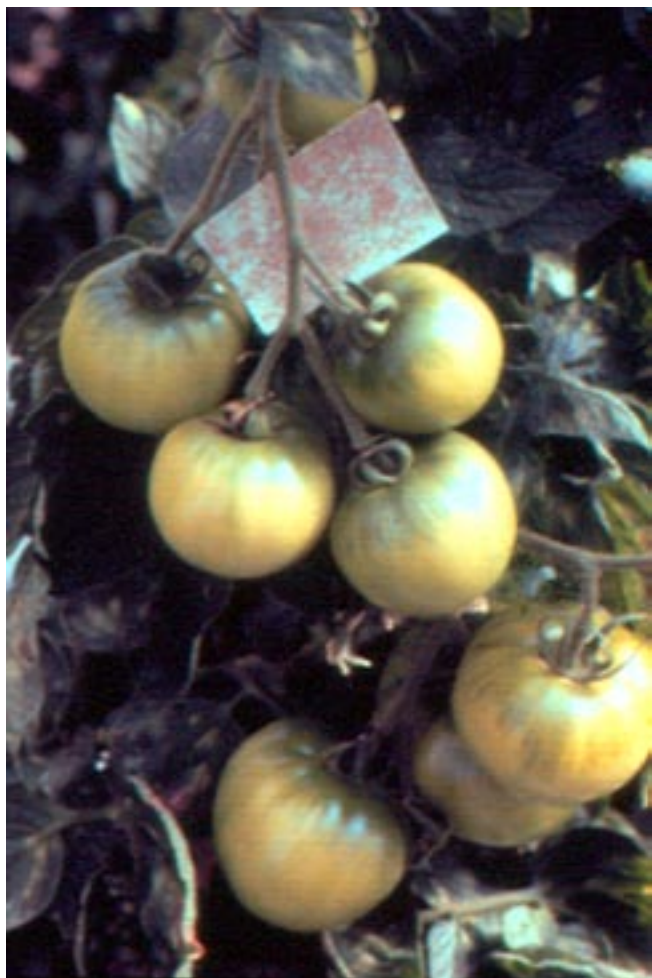
Fig. 7. Frutos de tomate com pedaço de cartela de ovos parasitados por Trichogramma pretiosum .

O controle biológico com T. pretiosum e B. thuringiensis tem assegurado controle eficiente e com menor custo (Figura 8). As taxas de parasitismo oscilam entre 20% e 45% e a redução dos gastos com a aplicação de inseticidas pode alcançar 80%. Assim, para o controle satisfatório da traça é fundamental empregar também as medidas recomendadas em práticas culturais. A principal dificuldade do controle biológico ainda é a falta de laboratórios capacitados para criar e vender o T. pretiosum . Todavia, já existem empresas especializadas que criam e comercializam este parasitóide, tais como: BUG AGENTES BIOLÓGICOS, em Piracicaba - SP e MEGABIO - Produtos Biológicos Ltda., em Uberlândia - MG.