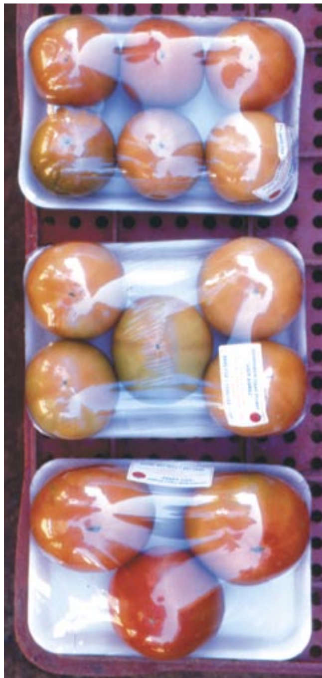
Fig. 8. Tomates produzidos em ambiente protegido com a aplicação do manejo integrado da traça-do-tomateiro.

O controle biológico com T. pretiosum e B. thuringiensis tem assegurado controle eficiente e com menor custo (Figura 8). As taxas de parasitismo oscilam entre 20% e 45% e a redução dos gastos com a aplicação de inseticidas pode alcançar 80%. Assim, para o controle satisfatório da traça é fundamental empregar também as medidas recomendadas em práticas culturais. A principal dificuldade do controle biológico ainda é a falta de laboratórios capacitados para criar e vender o T. pretiosum . Todavia, já existem empresas especializadas que criam e comercializam este parasitóide, tais como: BUG AGENTES BIOLÓGICOS, em Piracicaba - SP e MEGABIO - Produtos Biológicos Ltda., em Uberlândia - MG.