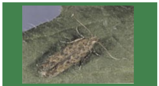
Fig.1. Adulto da traça-do-tomateiro.

O ciclo completo da traça-do-tomateiro dura de 26 a 30 dias. Os adultos são pequenas mariposas de coloração cinza-prateada, que medem cerca de 10 mm de comprimento (Figura 1). Durante o dia, os adultos escondem-se entre as folhas do tomateiro. Os adultos acasalam-se predominantemente ao amanhecer e ao entardecer. Cada fêmea pode depositar de 55 a 130 ovos durante 3 a 7 dias.