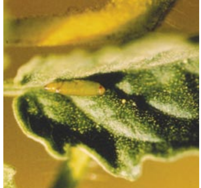
Fig. 5. Pupa da traça-do-tomateiro.

As lagartas apresentam hábito alimentar mastigador, minam as folhas, perfuram o caule, o broto terminal e os frutos, principalmente na região de inserção do cálice, onde encontram apoio para penetrar no tecido (Figura 4). Em períodos chuvosos, é comum o apodrecimento dos frutos no campo, devido a ocorrência de uma bacteriose ( Erwinia spp.), que penetra nos frutos por meio dos ferimentos causados pelas lagartas.