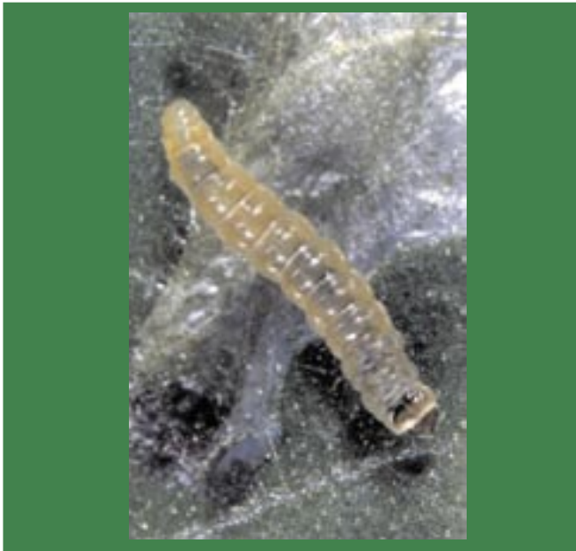
Fig. 3. Lagarta da traça-do-tomateiro.