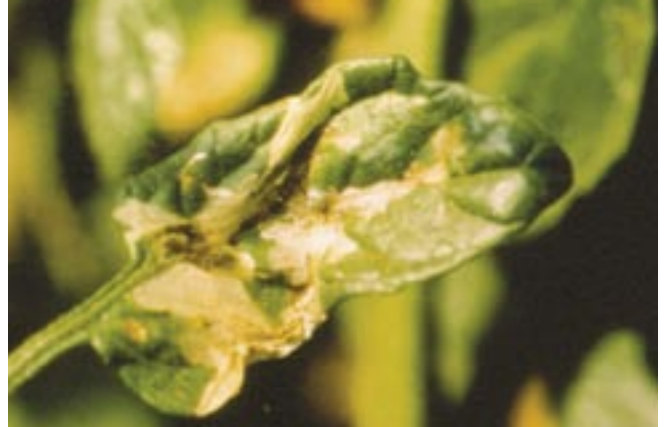
Fig. 4. Danos causados pela traça-do-tomateiro