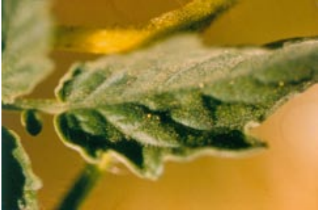
Fig. 2. Ovos da traça-do-tomateiro.